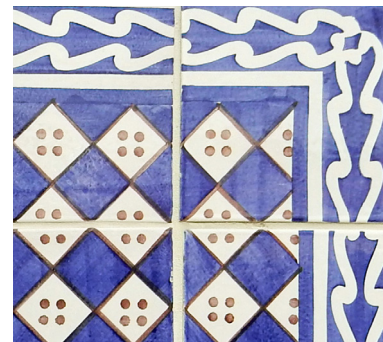
SENS DU DÉCOR